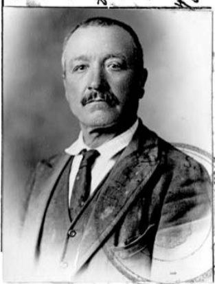
FIRMA DEL TITOLARE

Statura: alta. Capelli: Neri Occhi: castani. Naso: aquilino. Bocca: labbra rosse. Pelle: bruna. Significativa cicatrice sopra il petto sinistro.