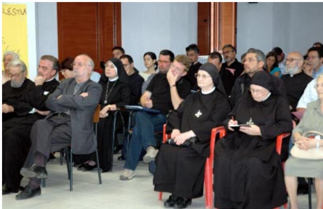
Partecipanti alla XVIII Assemblea diocesana