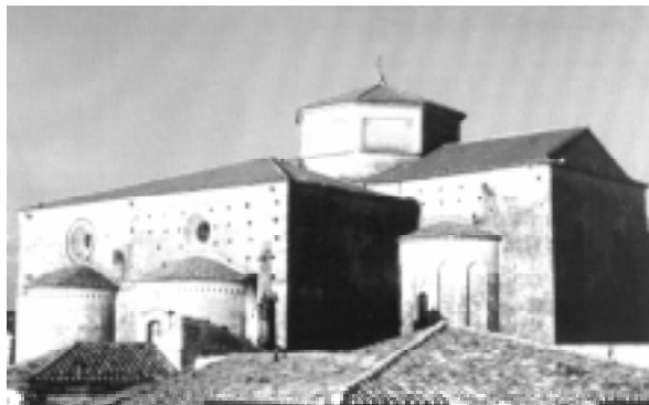
La Cattedrale di Gerace (RC)

"la storia ed il sacro appartengono solo a Dio" .