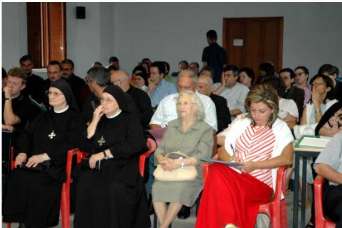
Partecipanti alla XVIII Assemblea Diocesana

6) Maria, donna eucaristica, “Fate quello che Egli vi dirà...” Amatevi come io vi ho amato!