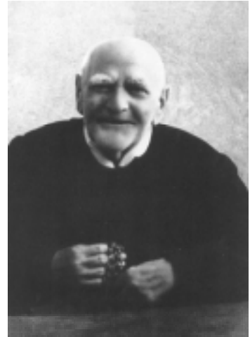
Beato Padre Gaetano Catanoso

Mons. Mondello nella sua omelia ha puntualizzato con chiarezza la necessità di una vera comunione tra vescovi e presbiteri, ma anche l'esigenza di una comunione tra le diverse diocesi calabresi. Ha precisato che ogni anno si terrà questo momento d'incontro e confronto che sarà itinerante e coinvolgerà di volta in volta le dodici diocesi della regione generando, ovunque una vera apertura dei cuori ed uno stile di fraternità, di amore e di