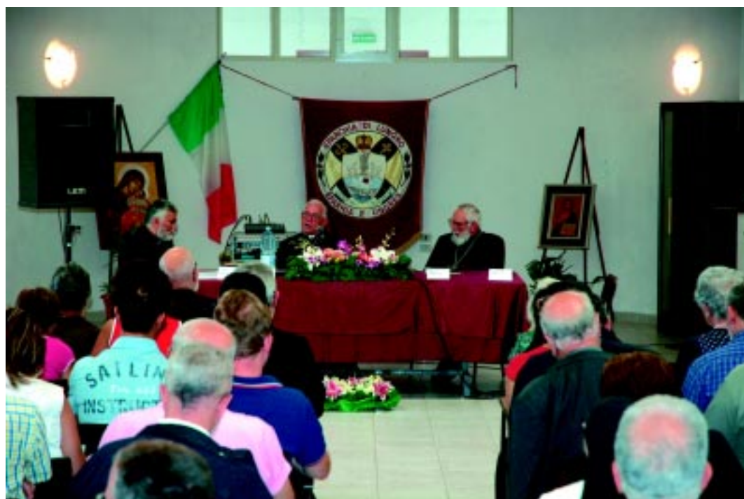
Lungro. XVIII Assemblée Diocesana